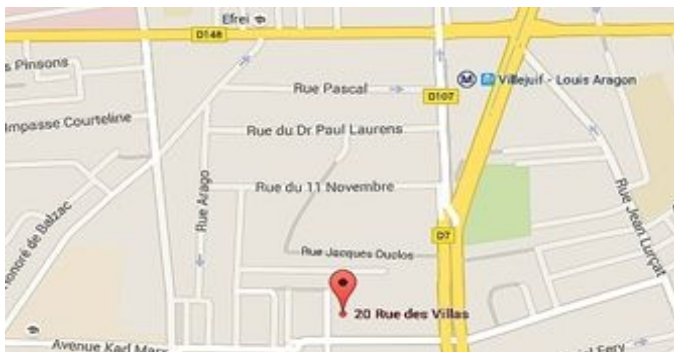
Maison des Parents - 20 rue des Villas - 94800 Villejuif

Prendre un rendez-vous au : 01 46 01 99 19