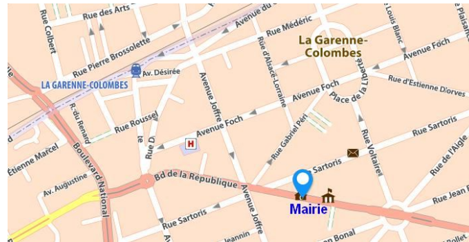
Mairie - 68 Bld de la République, 92250 La Garenne-Colombes