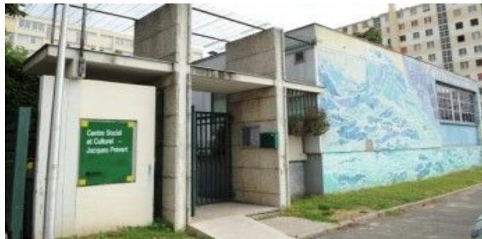
Centre Social Prévert – 12 Place Claude Debussy

Permanences réalisées avec le soutien de :