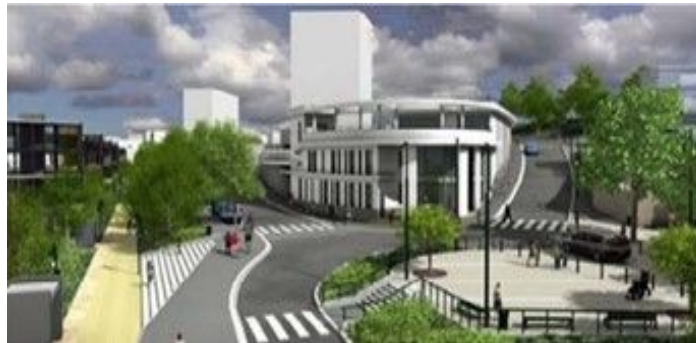
Centre Social Fontaine-Gueffier – 1 Place Fontaine-Gueffier

2 permanences d'information et de Médiation Familiale à Bagneux