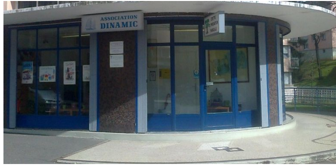
Siège social 21 Avenue Albert Thomas