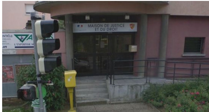
Maison de Justice et du Droit – 1 Ave Francis de Pressencé

Permanences d'information et de Médiation Familiale réalisées avec le soutien de :