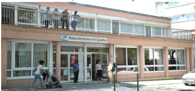
Maison des Jeunes et de Quartier 4 Boulevard Barbusse

Permanences d'information et de Médiation Familiale réalisées avec le soutien de :