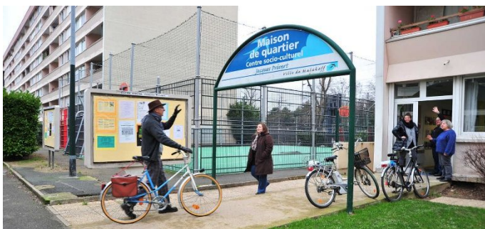
Maison de Quartier 9 rue Jacques Prévert

Prendre un rendez-vous au : 01 46 01 99 19